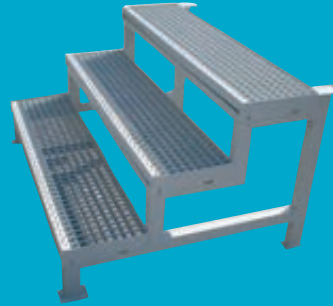
Optionale externe Tanktreppe für Abwassertanks Standard